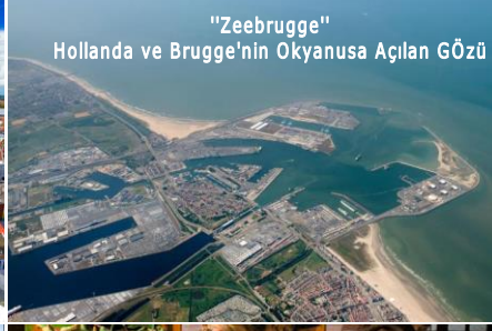
"Zeebrugge" Hollanda ve Brugge'nin Okyanusa Açılan Gözü